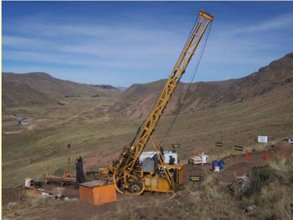
ALPACOCHA, MINERA SUROESTE CURAHUASI – APURIMAC