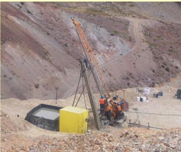
ANCHACA – CORI CONDOR CAYLLOMA