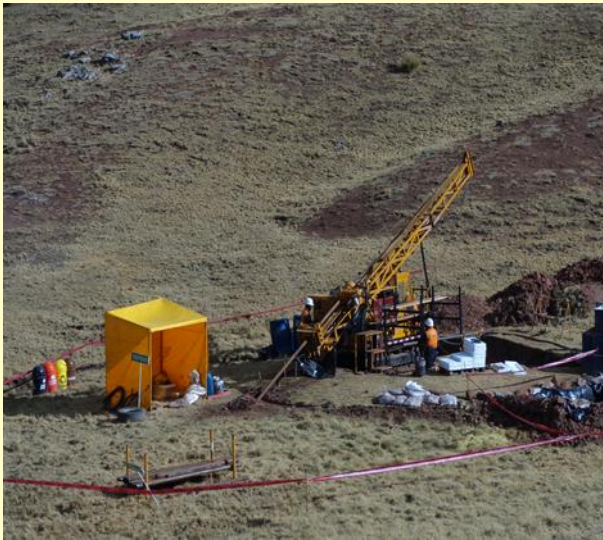
INMACULADA , HOSCHILD AYACUCHO