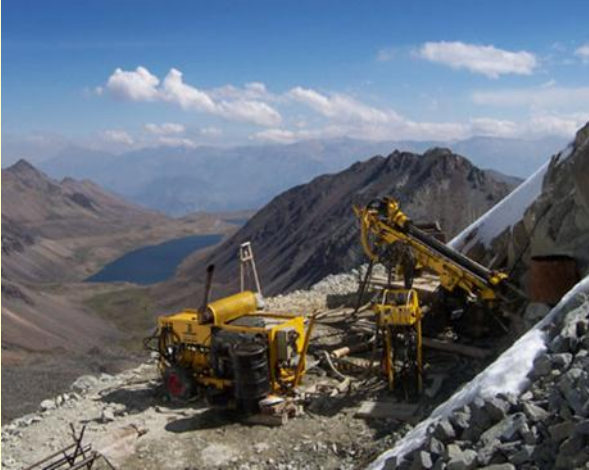
MINERA SHILA – CEDIMIN CAYLLOMA