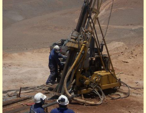
PACOCHA – JUNEFIELD GROUP MOQUEGUA