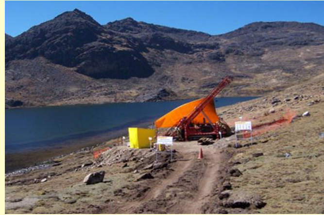
CRUCERO, PACACORRAL, LUPAKAGOLD PUNO